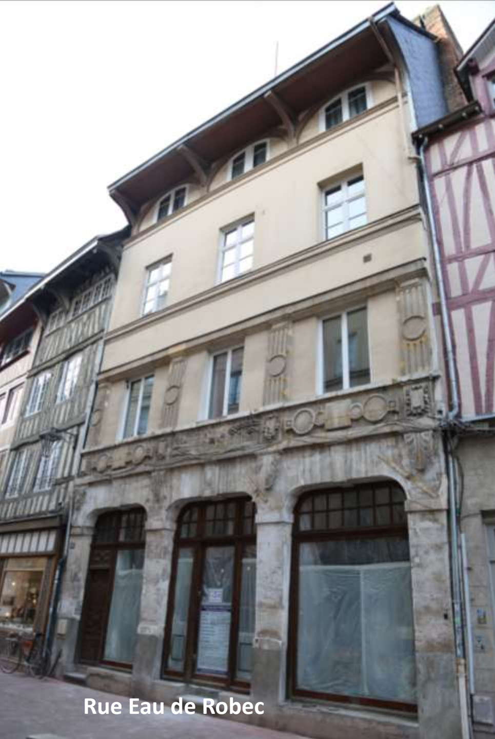
Rue Eau de Robec