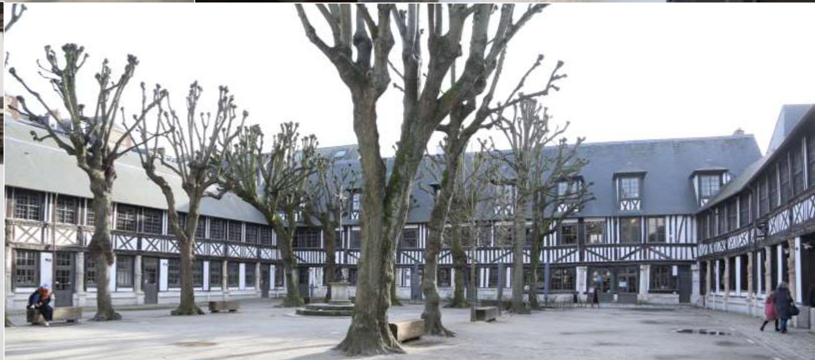
L'âtre Saint MACLOU