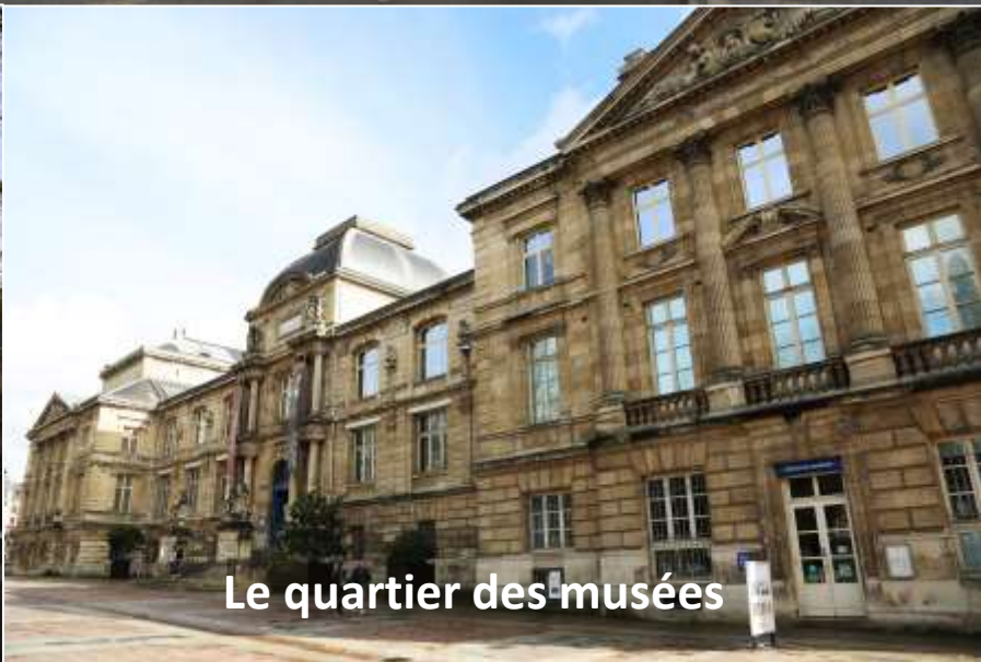
Le quartier des musées