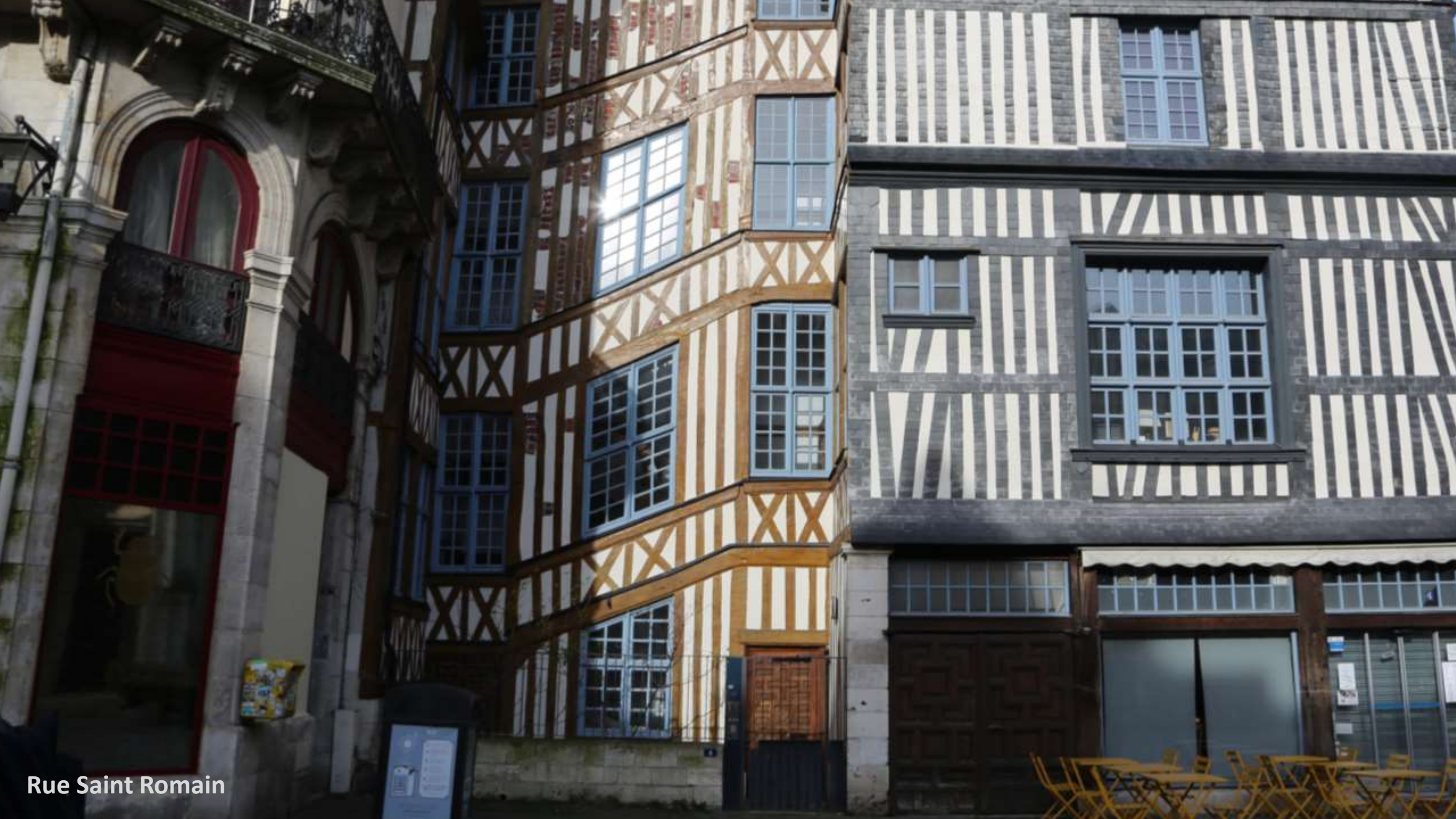
Rue Saint Romain