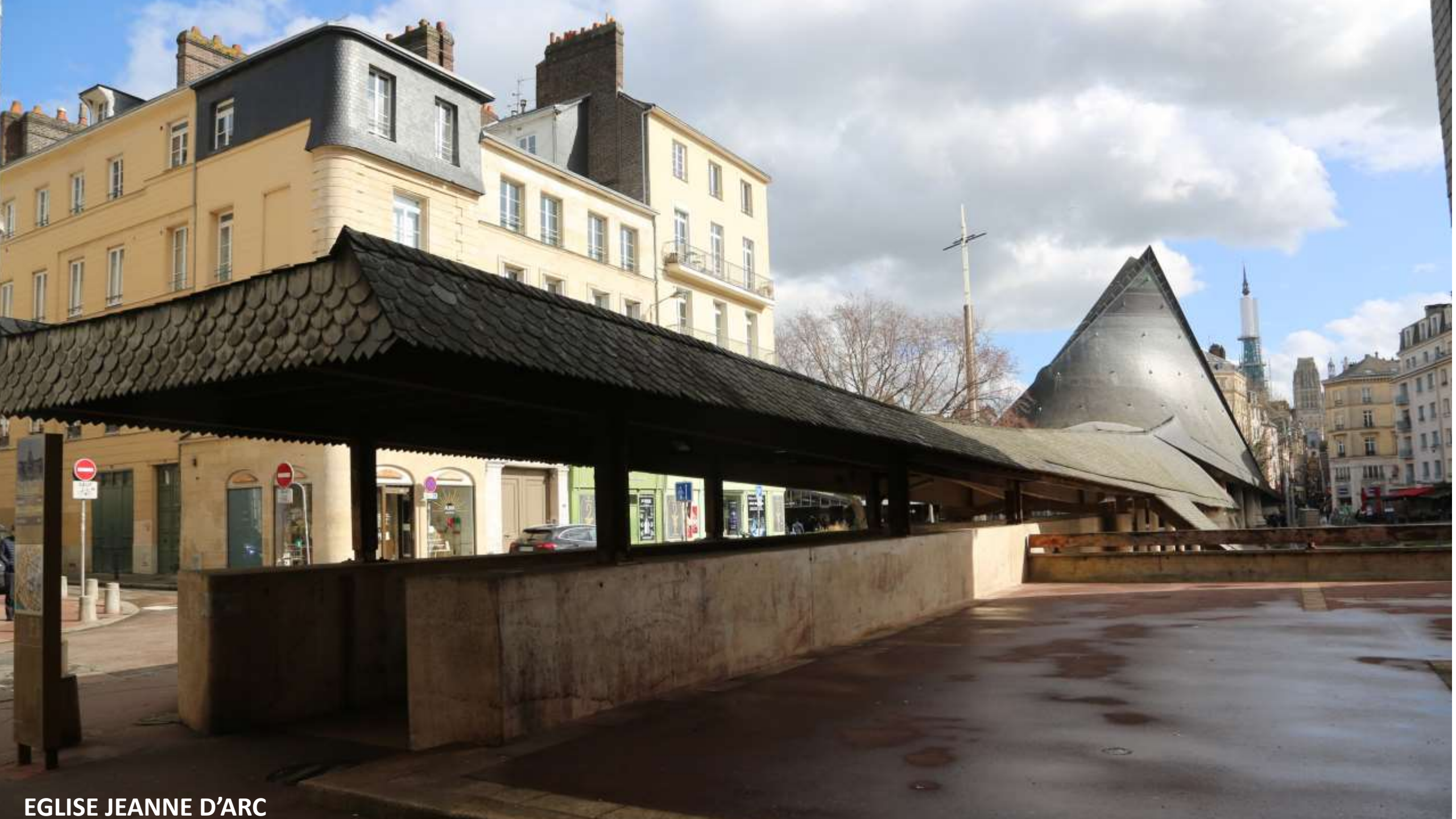
EGLISE JEANNE D'ARC