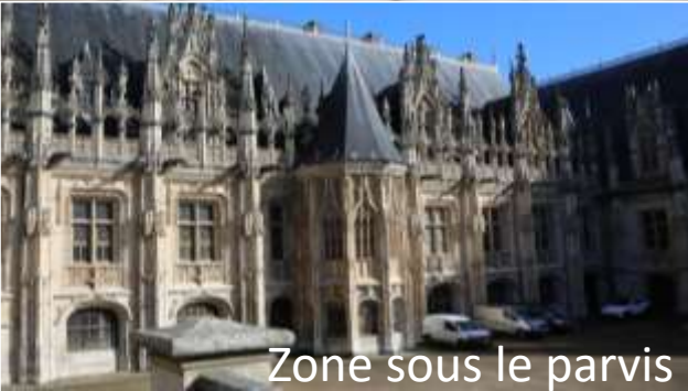
Zone sous le parvis