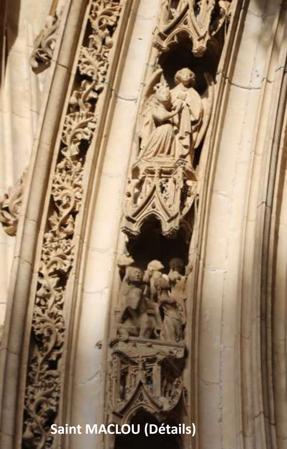
Saint MACLOU (Détails)