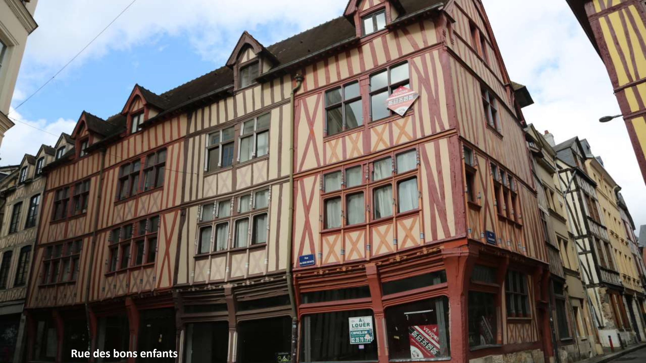
Rue des bons enfants