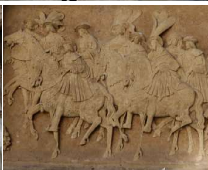
HOTEL DE BOURGUETHEROULDE