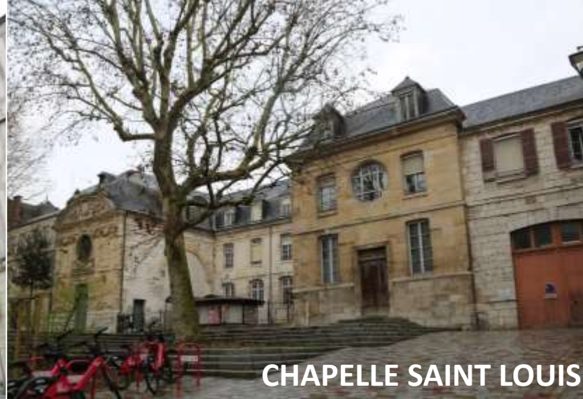
CHAPELLE SAINT LOUIS