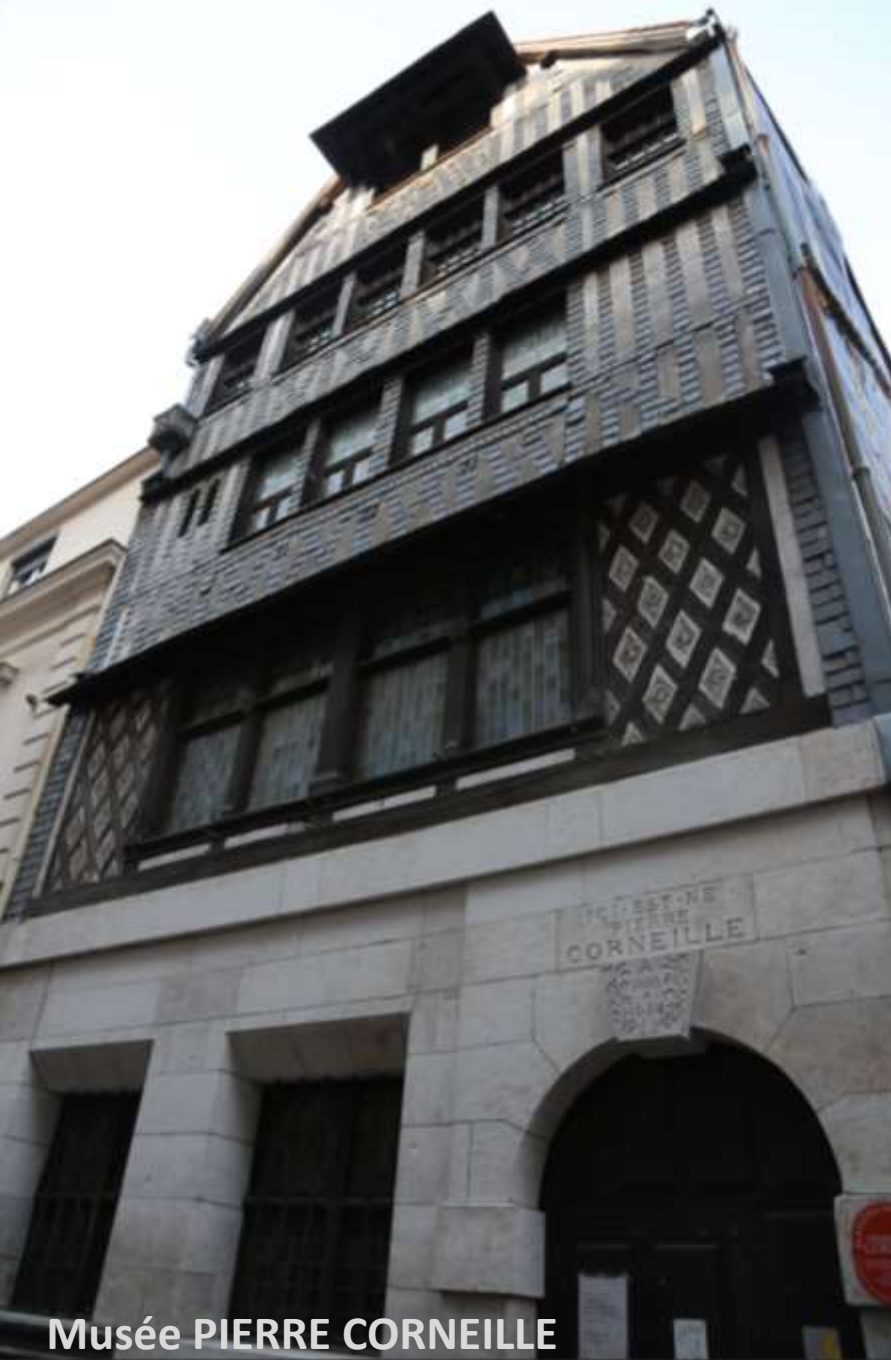
Musée PIERRE CORNEILLE