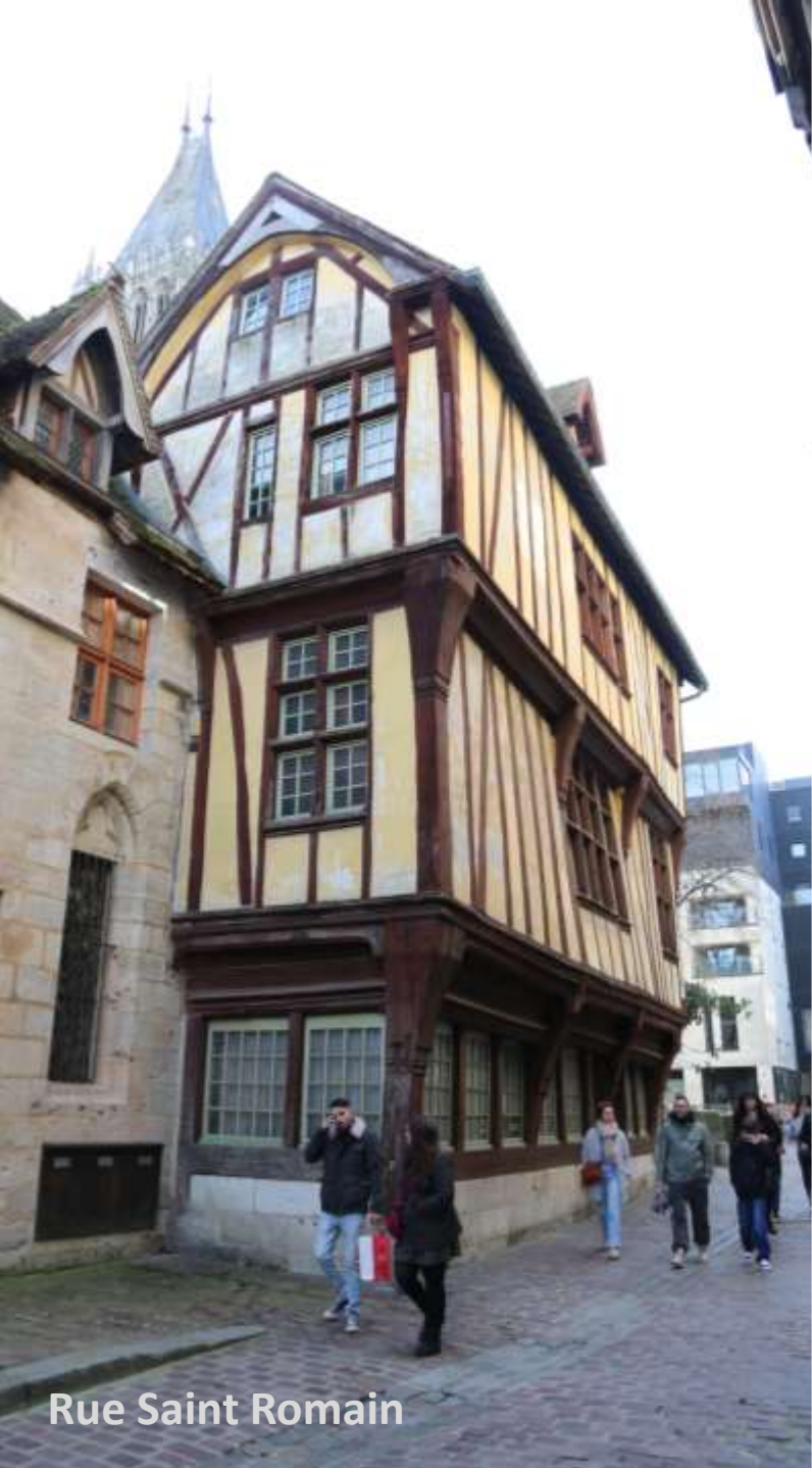
Rue Saint Romain