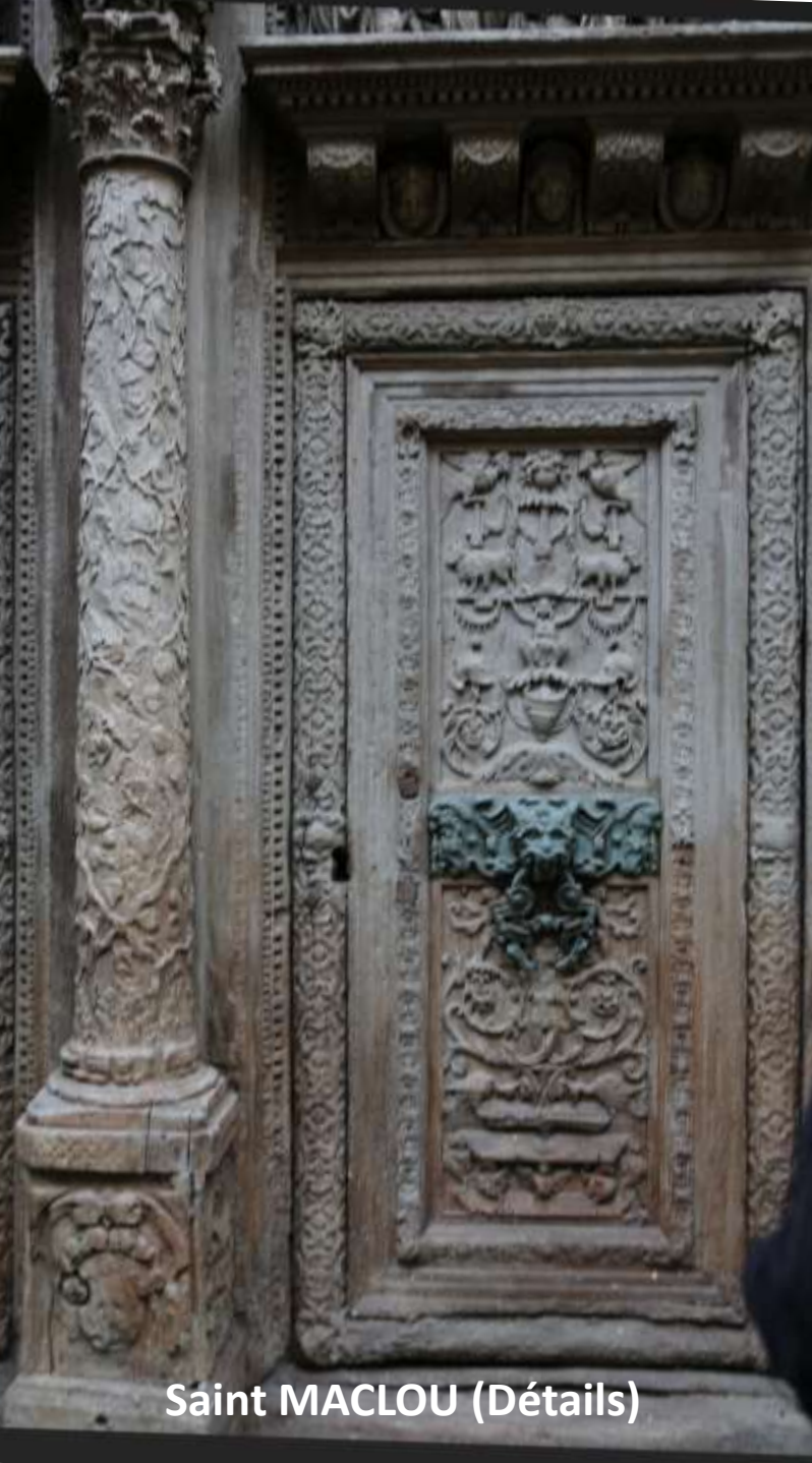
Saint MACLOU (Détails)