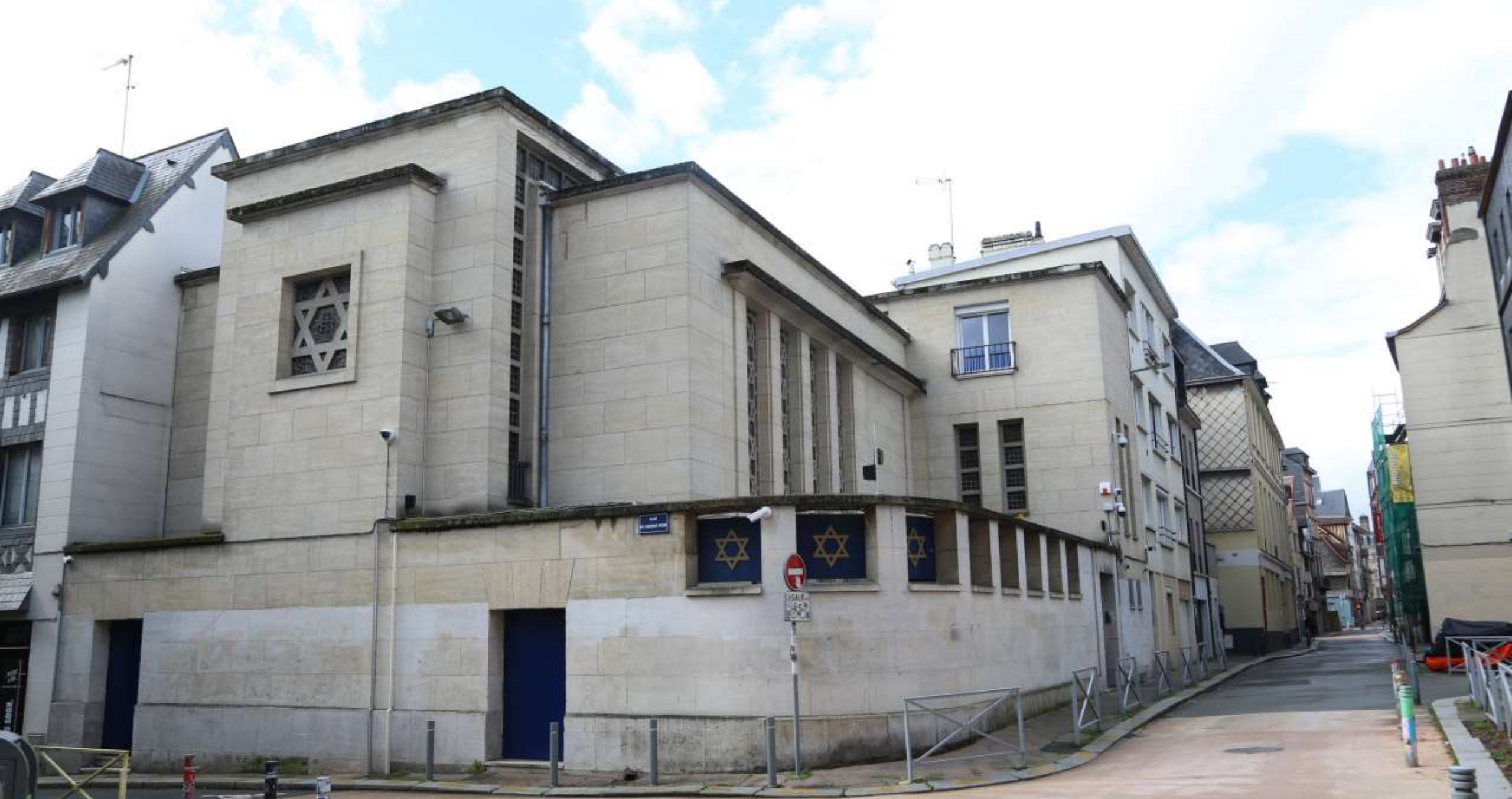
La Synagogue - Rue des bons enfants/ Rue de l'ancienne prison