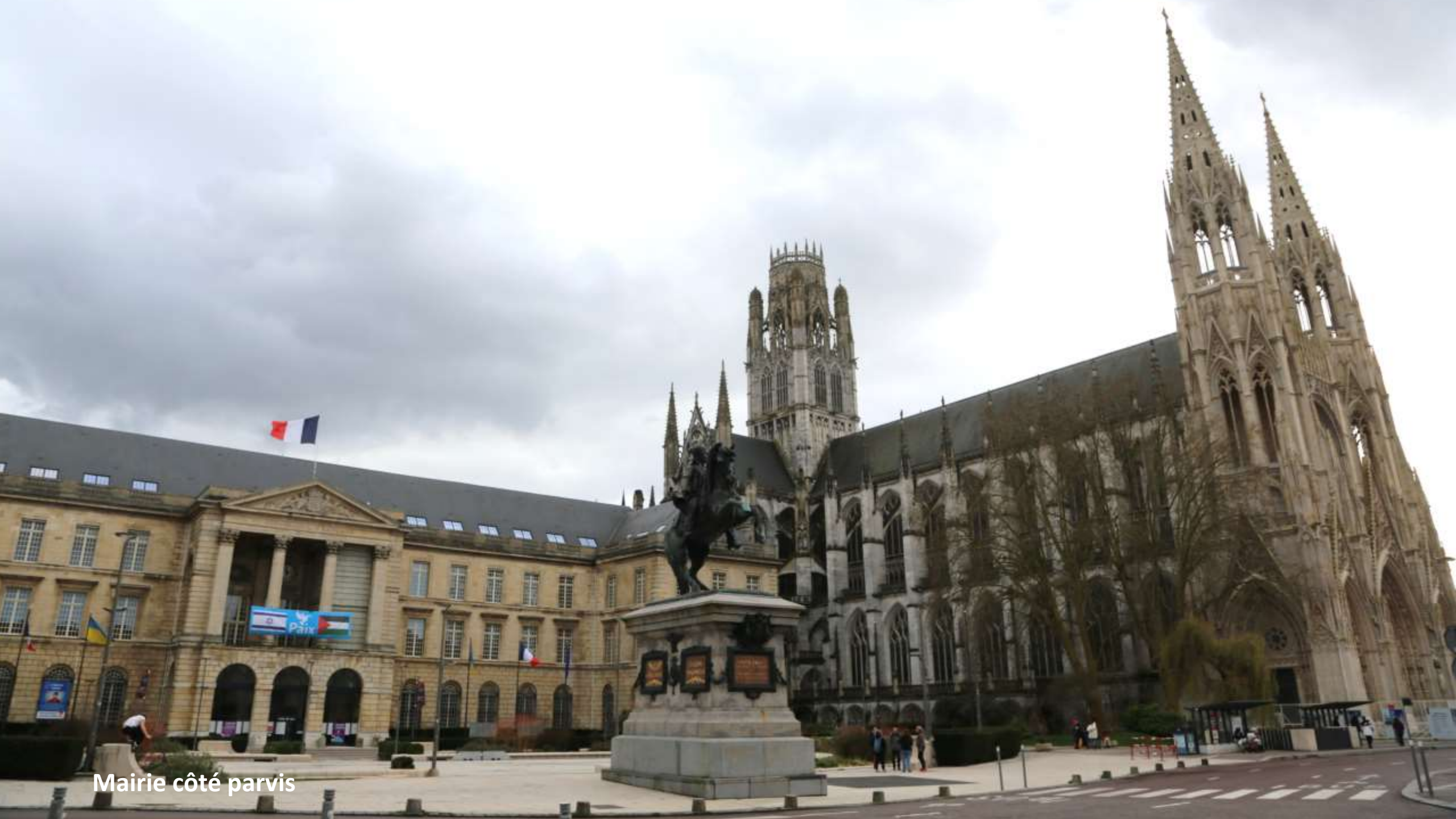
Mairie côté parvis