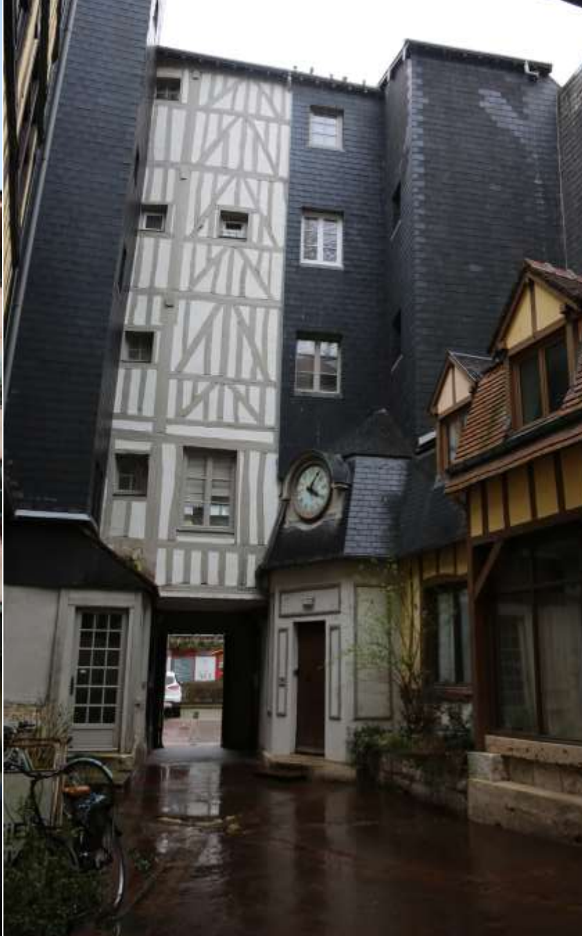
Passage de la petite Horloge