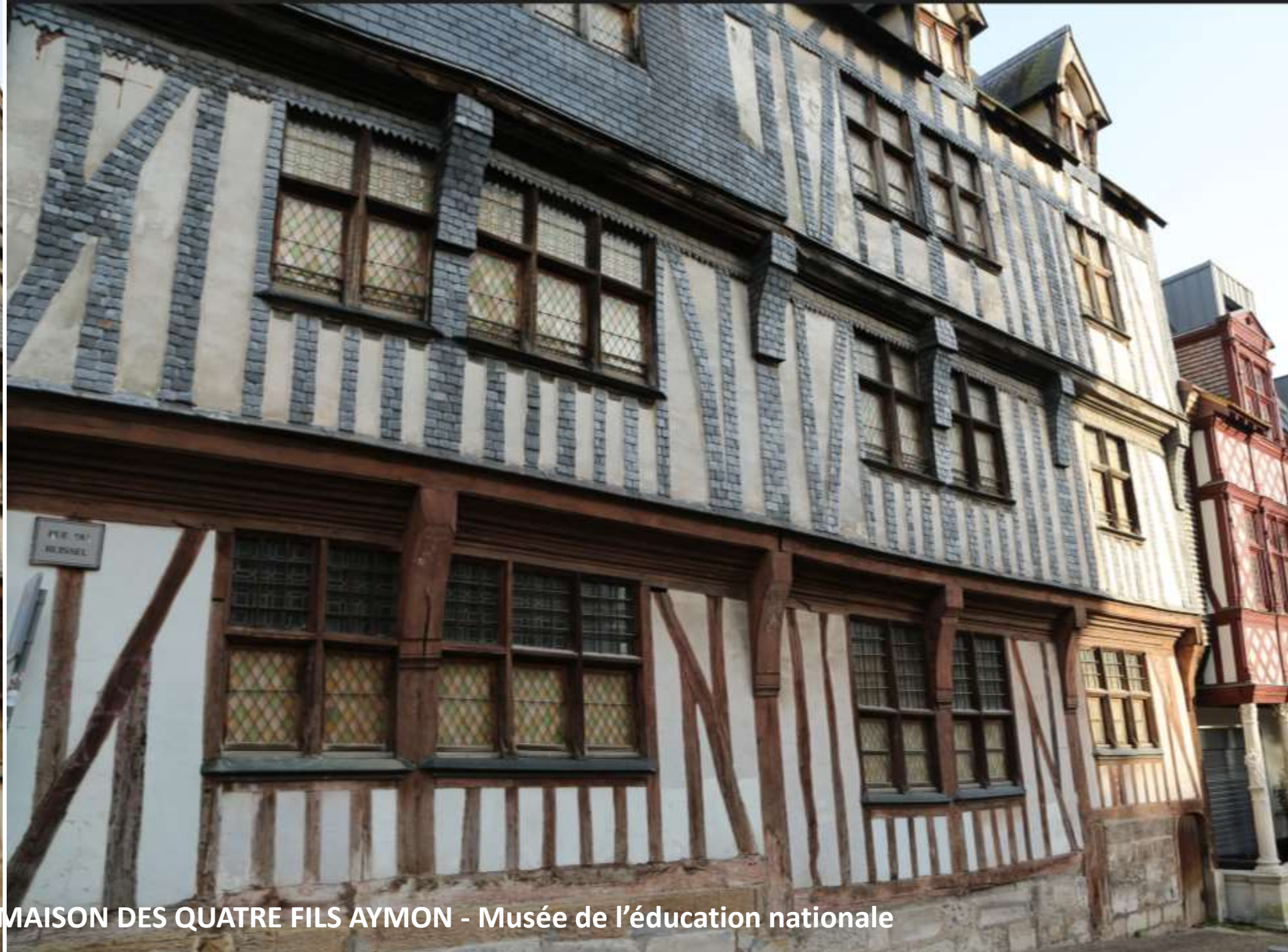
Rue Eau de Robec – LA MAISON DES QUATRE FILS AYMON - Musée de l'éducation nationale