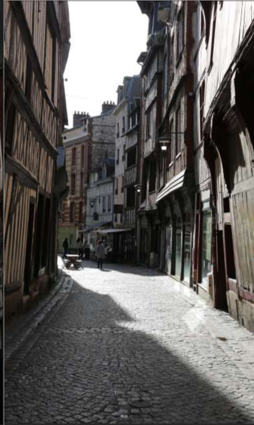
Rue de la Vicomte