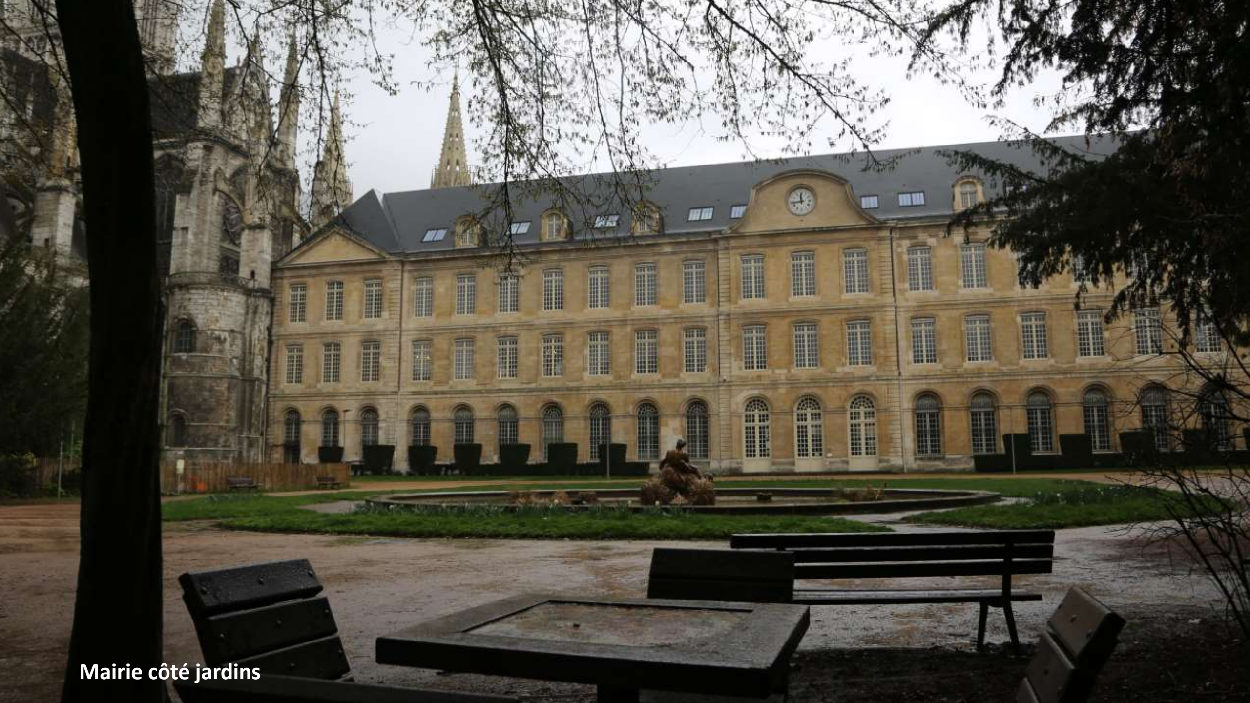
Mairie côté jardins