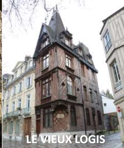
LE VIEUX LOGIS