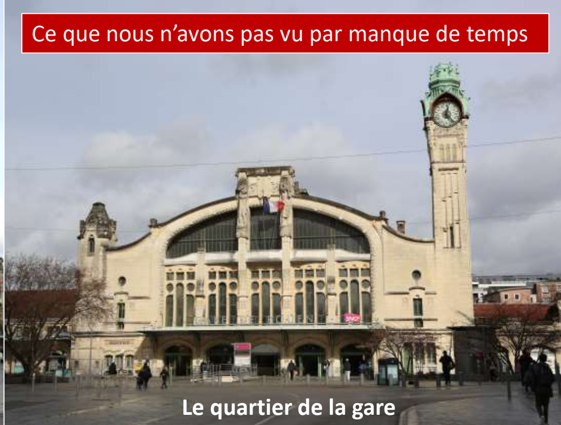
Le quartier de la gare