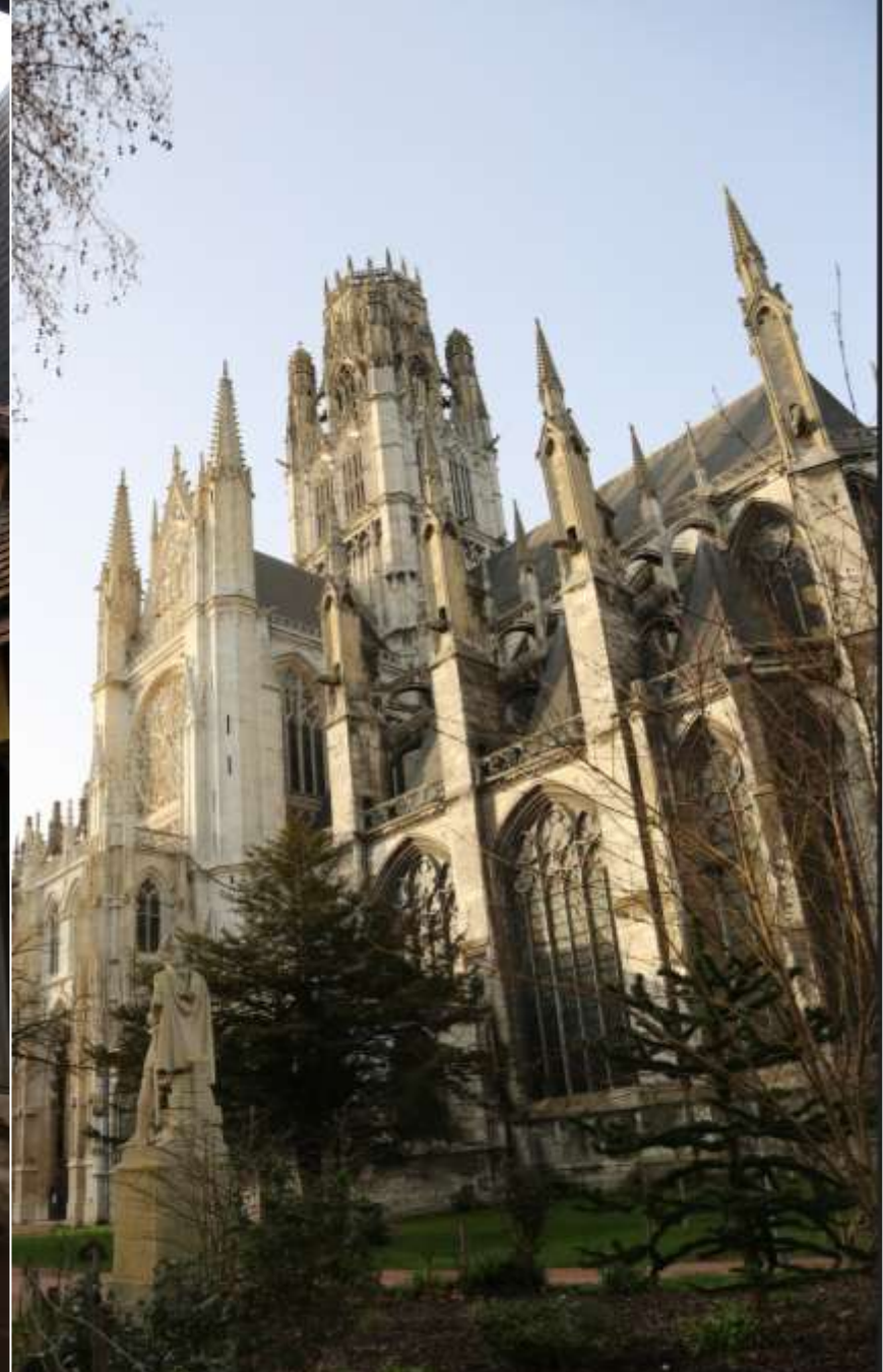
Les jardins de Saint Ouen