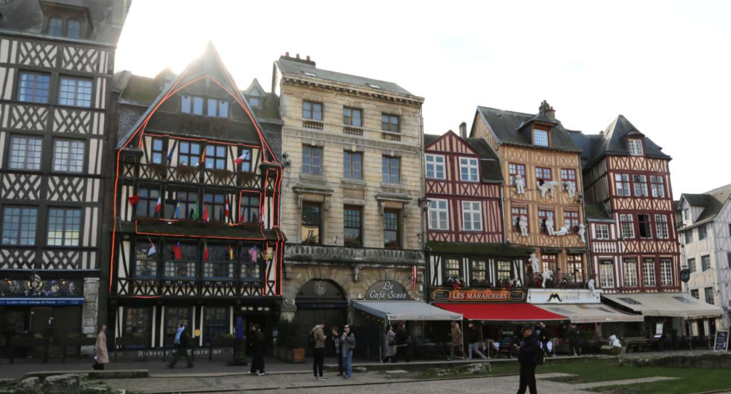
LES RESTAURANTS PLACE DU VIEUX MARCHÉ