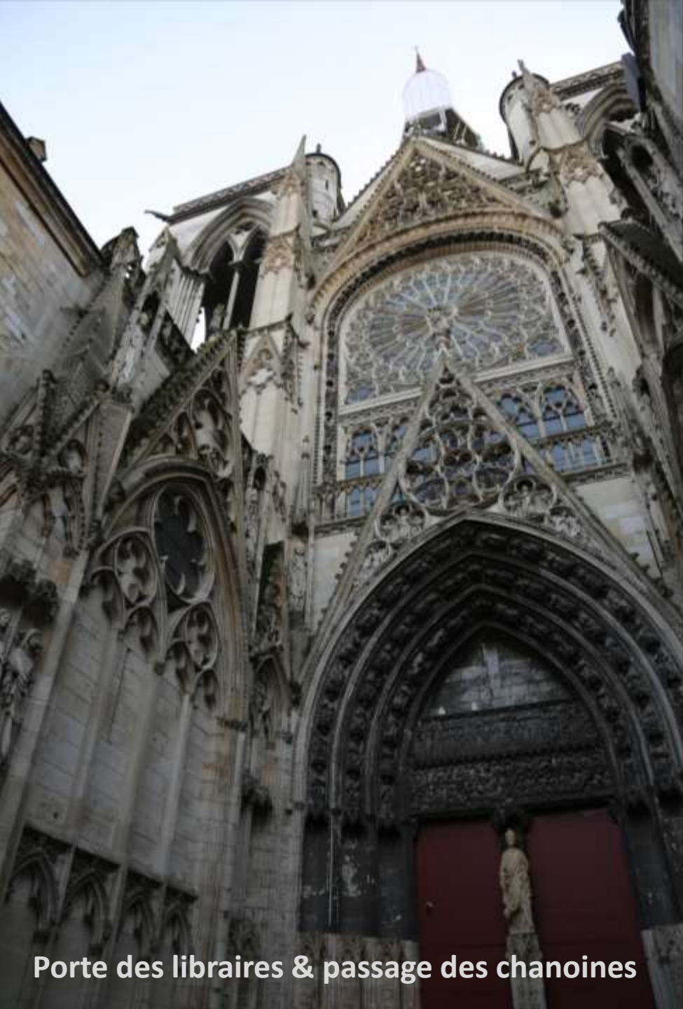
Porte des libraires & passage des chanoines