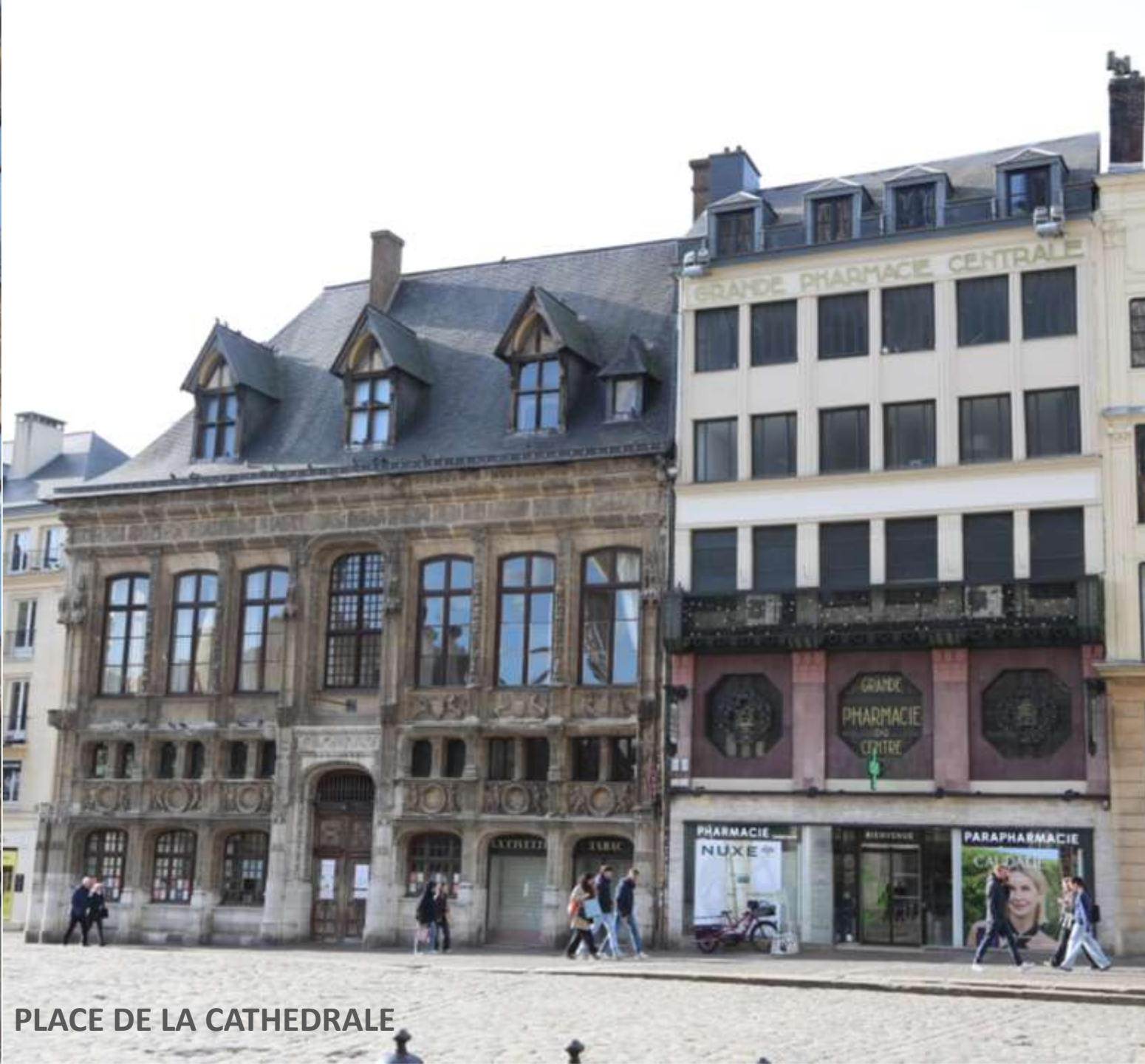
PLACE DE LA CATHEDRALE