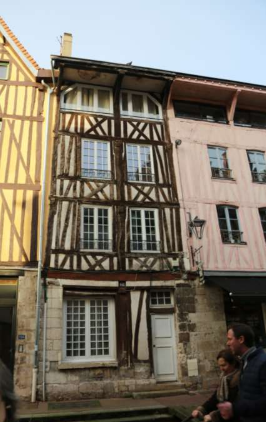
Rue Eau de Robec – La maison d'Exception